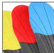
Vario Wide Fit System