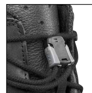
HAIX® Smart Lacing