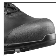
HAIX® Composite toe cap