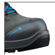
Coque de protection HAIX® en nanocarbonate