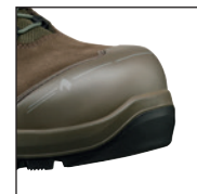
Coque de protection HAIX® en nanocarbone